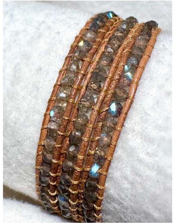
90 26€ Pulseira de 3 voltas em pedras semi preciosas, labradorite, pele camel