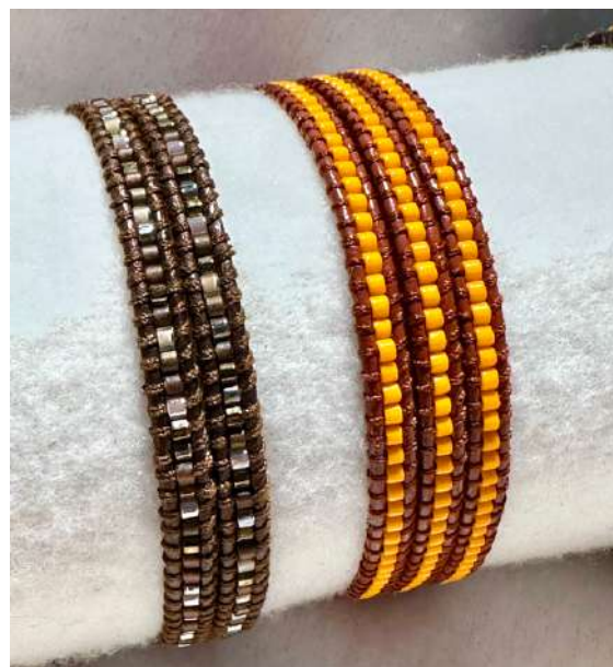
31 | 32 16€ e 18€