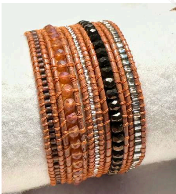
13 24€ Pulseira com 5 voltas em tons castanho e prateado, miyuki 2mm em pele de cor camel