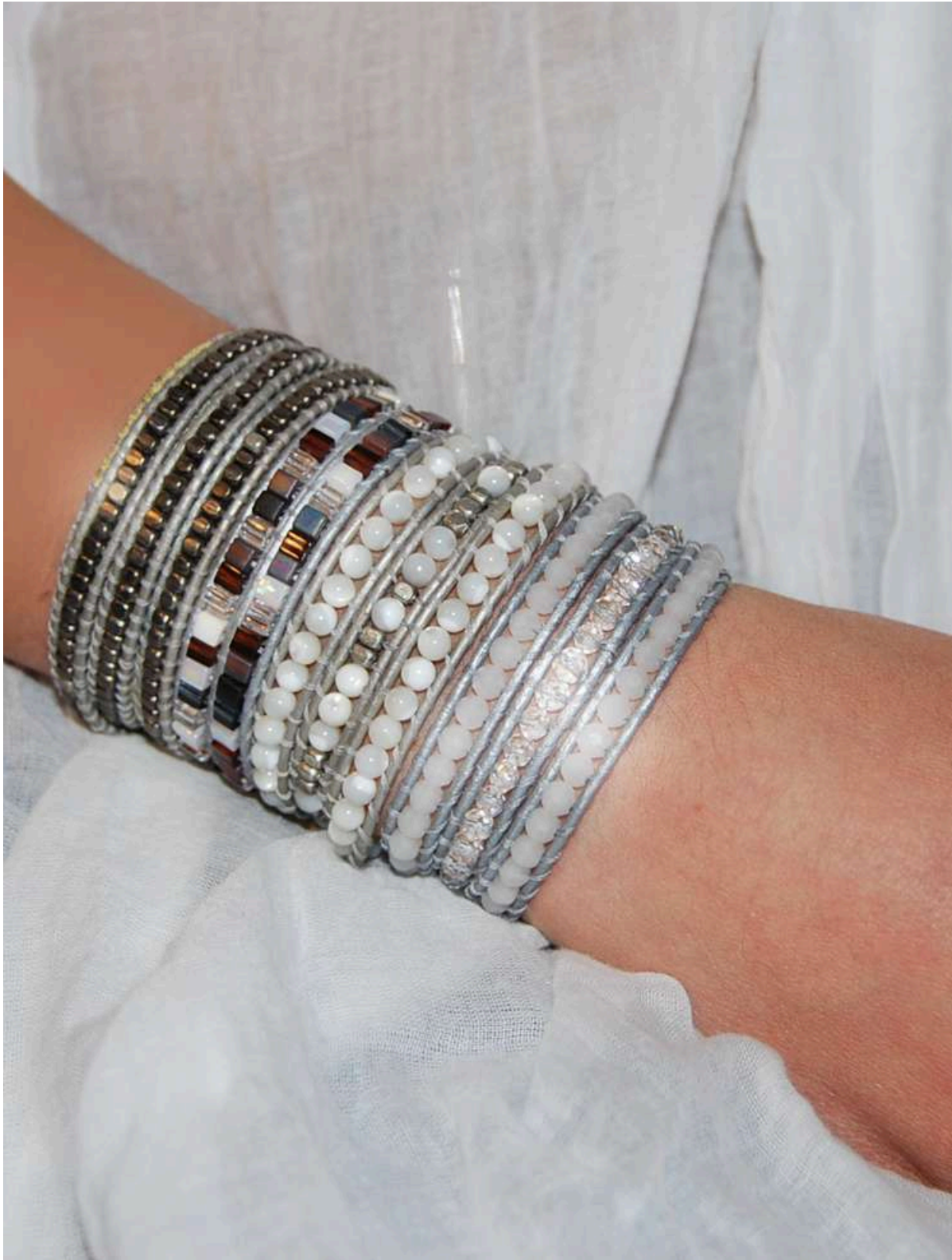
Combinação de 4 pulseiras