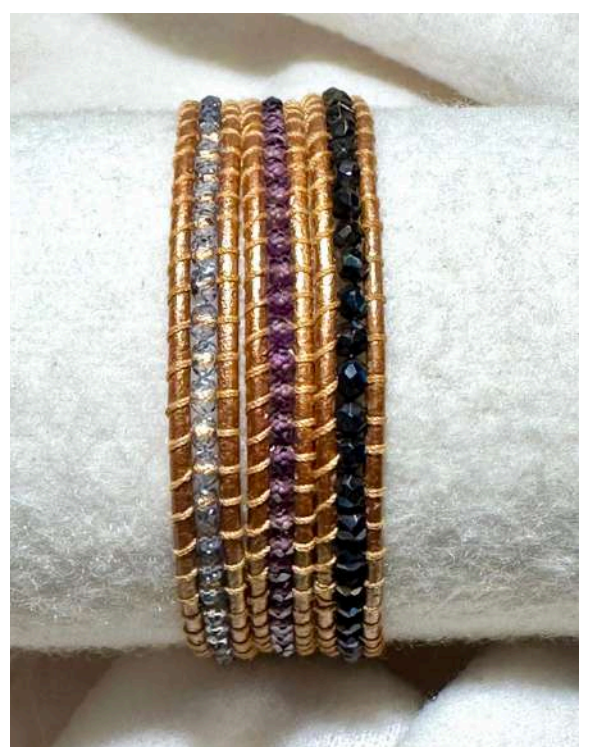
90 26€ Pulseira de 3 voltas: espinela, ametista labradorite, pele dourada