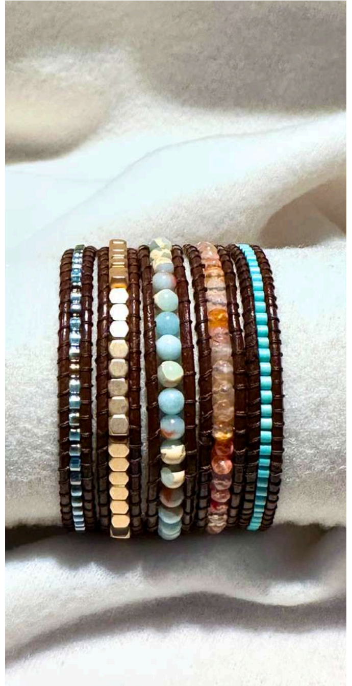
51 30€ Pulseira com 5 voltas, ágata, miyuki e latão em pele castanha