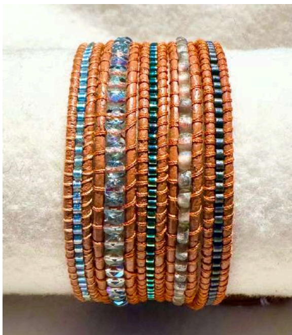
12 24€ Pulseira com 5 voltas em tons azuis e prateado, miyuki 2mm em pele de cor camel