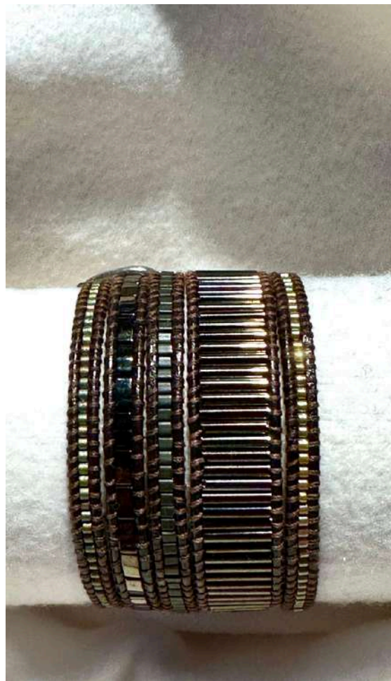
30 26€ Pulseira 5 voltas, miyuki varios tamanhos e formas com pele castanha