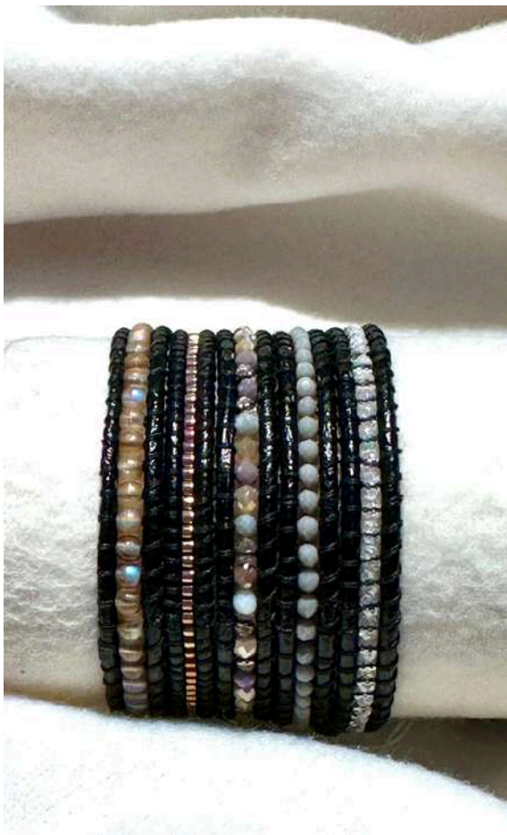
29 26€ Pulseira 5 voltas, vidro checo e cristal multicolor em tons cinza e dourado com pele preta