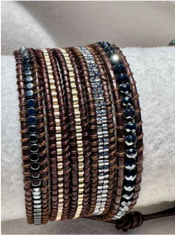
89 30€ 5 voltas, miyuki com banho de ouro e prata e onix, pele castanha