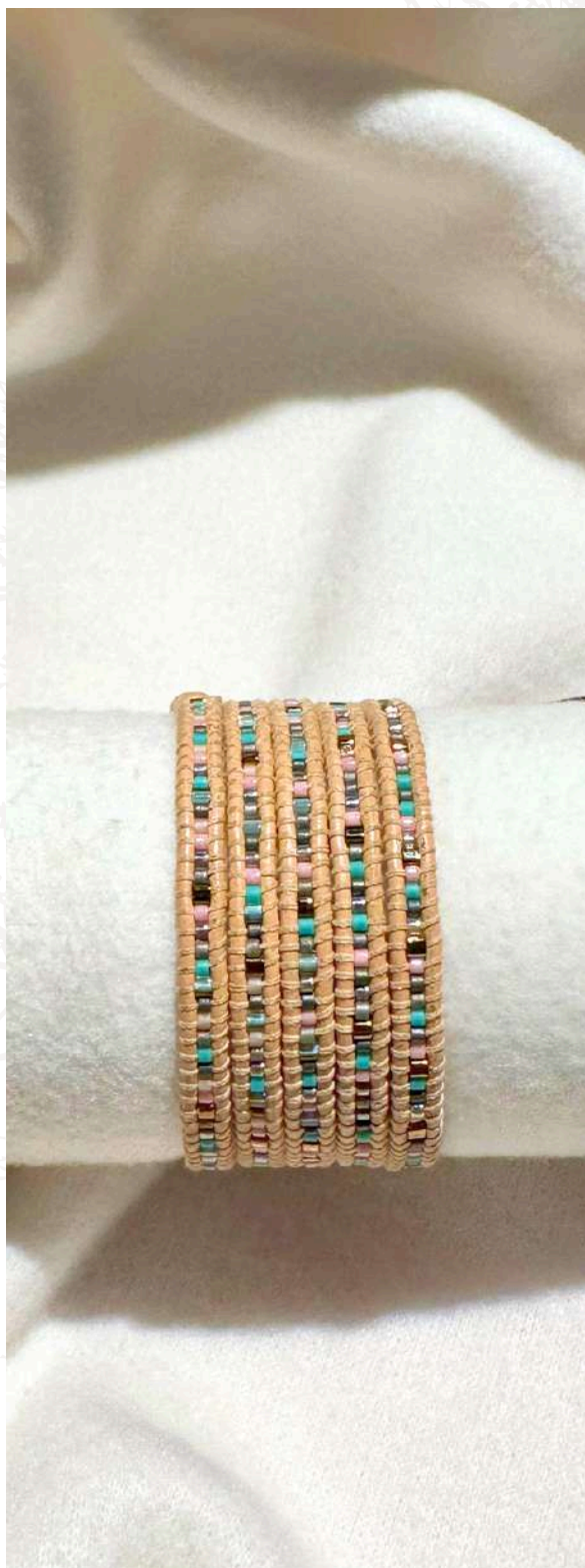
14 26€ Pulseira com 5 voltas multicolor, miyuki 2mm em pele de cor natural