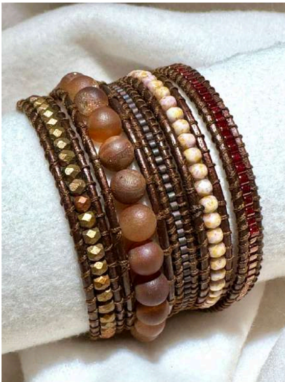
89 30€ Pulseira de 5 voltas em pedras semi preciosas, vidro checo e miyuki, pele castanha