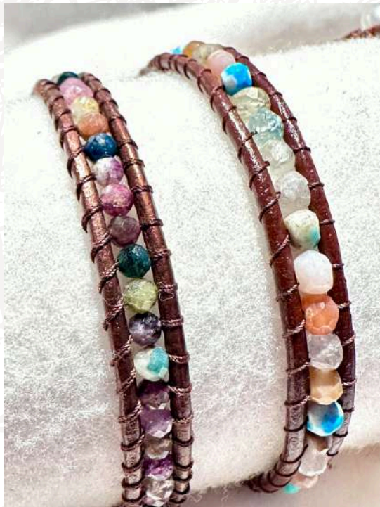
Pulseiras com 1 volta, turmalina facetada 3mm (lado esquerdo) em pele castanha, do lado direito pulseira com ágata facetada