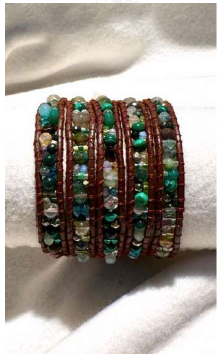
Pulseira com 5 voltas, mix de pedras semi-preciosas, desde malaquite, ágatas, pedra da lua, cristal de rocha e outras, tons azuis e verdes em pele castanha