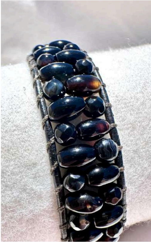
50 18€ Pulseira 1 volta, ágata e ónix com pele preta